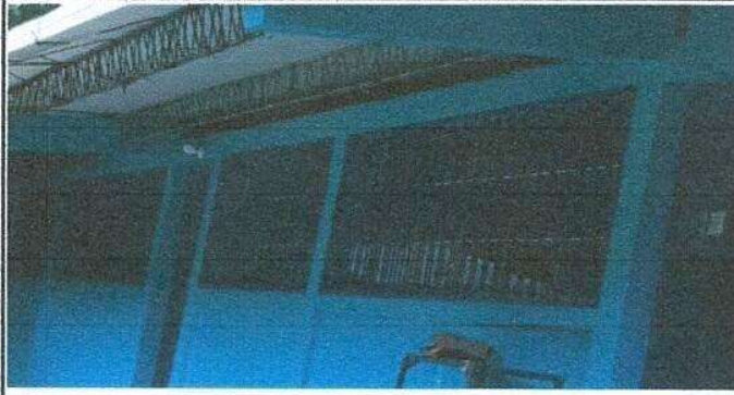
Foto1: Sustitución de vidrios.